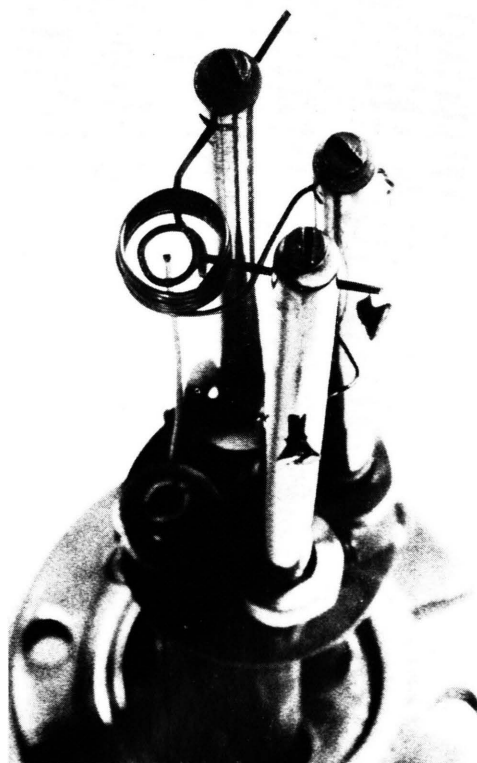
Abb. 1. Elektronenstrahlkanone aufgebaut auf einer Vierfach-Durchführung CF35. Heizwendel und Beschleunigungszylinder bestehen aus dem gleichen Material wie der aufzuschmelzende Probendraht.

Wyatt 8 und Shen 9, 10 haben durch Ausgasen widerstandsbeheizter Folien im Ultrahochvakuum den zu untersuchenden Supraleiter präpariert. Bei Versuchen, diese Methode anzuwenden, haben wir gefunden, daß beim Durchschmelzen der Folie schließlich zwei, durch geriefte Kristallite und einen zerklüfteten Schmelzrand gekennzeichnete Schmelzlinge entstehen, auf denen es schwierig ist, einen Tunnelkontakt sicher zu plazieren. Wir haben deshalb nach anderen Möglichkeiten gesucht, den Supraleiter sorgfältig auszugasen und dabei eine saubere und glatte Oberfläche zu schaffen. Das gelingt, indem wir von Probenmaterial in Drahtform (MRC, MARZ grade, \phi 1 mm) ausgehen. Mit Hilfe einer außerordentlich einfachen Elektronenstrahl-Kanone wird ein Drahtende aufgeheizt und nach sorgfältigem Ausgasen schließlich zu einer glatten Kugel aufgeschmolzen. Die Elektronenstrahl-Kanone ist auf einer kommerziellen Vierfach-Durchführung CF 35 aufgebaut (Abb. 1), wobei die Beachtung der UHV-technischen Gesichtspunkte gewährleistet, daß auch bei steigen-